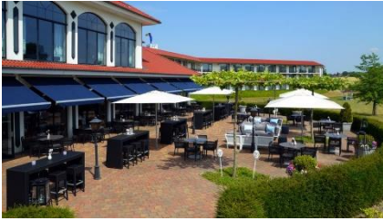
Van der ValkHotelterrasse