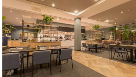
Van der Valk Restaurant „Roots“