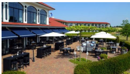
Van der Valk Hotelterrasse