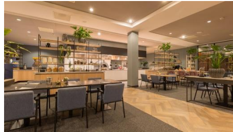
Van der Valk Restaurant „Roots“