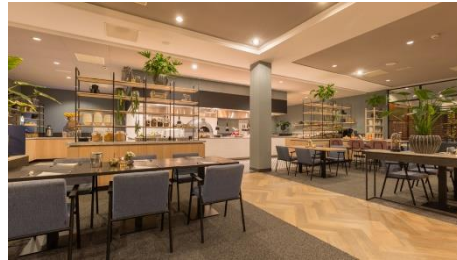
Van der Valk Restaurant „Roots“